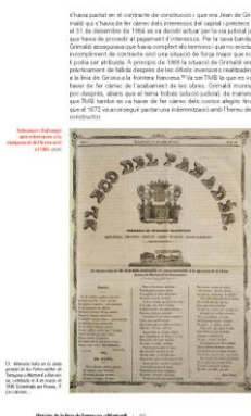
Història de la línia de Tarragona a Martorell

diversos actes commemoratius de la primera línia de ferrocarril que va travessar el Tarragonès i les comarques del Penedès per arribar a Martorell i des d'allí a Barcelona. Més enllà dels actes populars, de l'exposició itinerant que encara es presenta a diverses poblacions de les nostres comarques, del documental que s'hi projecta i de l'enregistrament del disc Les músiques del ferrocarril , la voluntat de la realització d'aquest volum és la de poder aplegar tota la informació històrica, tècnica, econòmica i humana de la nostra línia ferroviària.