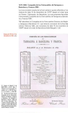
Història de la línia de Tarragona a Martorell

diversos actes commemoratius de la primera línia de ferrocarril que va travessar el Tarragonès i les comarques del Penedès per arribar a Martorell i des d'allí a Barcelona. Més enllà dels actes populars, de l'exposició itinerant que encara es presenta a diverses poblacions de les nostres comarques, del documental que s'hi projecta i de l'enregistrament del disc Les músiques del ferrocarril , la voluntat de la realització d'aquest volum és la de poder aplegar tota la informació històrica, tècnica, econòmica i humana de la nostra línia ferroviària.