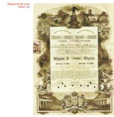
Història de la línia de Tarragona a Martorell

Aquesta edició, però, necessita el vostre suport econòmic . Si en el seu moment no vàreu adquirir el volum ara és l'hora de fer-ho, en el nostre centre d'estudis podeu trobar l'edició especial que al preu de 28 euros inclou el CD amb la suite Les músiques del ferrocarril , composta especialment per aquesta ocasió pel músic i