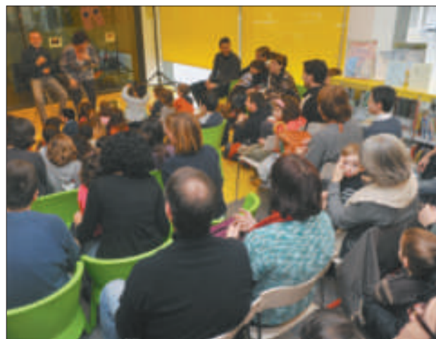
L'hora del conte es dedica a la solidaritat a l'octubre

La natura ocupa també un lloc important en l'exposició Els ex-libris i la muntanya que la biblioteca exposa a partir del